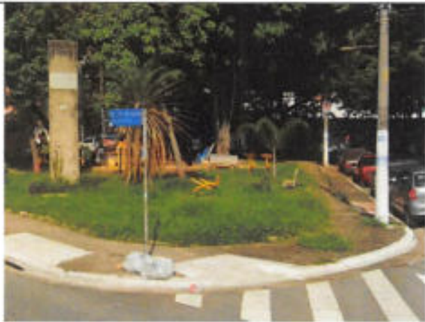
FOTO 01 – ESPAÇO A SER REVITALIZADO